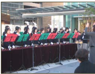
聖マリア女学院の ハンドベル演奏

《出演者（出演順）》 聖マリア女学院（ハンドベル、合唱）／ぎふ児童合唱団／岐阜ジュニア吹奏楽団／岐阜県民による第九合唱団