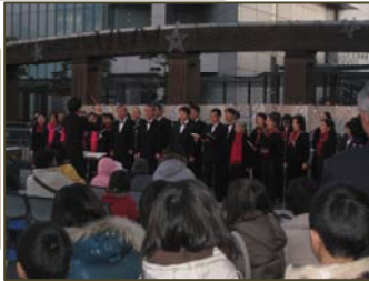
岐阜県民による 第九合唱団