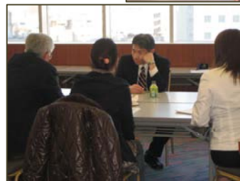
真剣に意見を聞く 相談者

岐阜市とT・H・Bファシリティズは、起業家向けのビジネスセミナーを開催しました。（協力／岐阜商工会議所、NPO法人G-net）