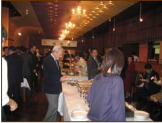
料理を楽しむ出席者